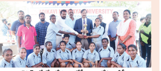
రెటమ్: ఖోఖో విజేతలకు ట్రోఫీని అందజేస్తున్న వీసీ