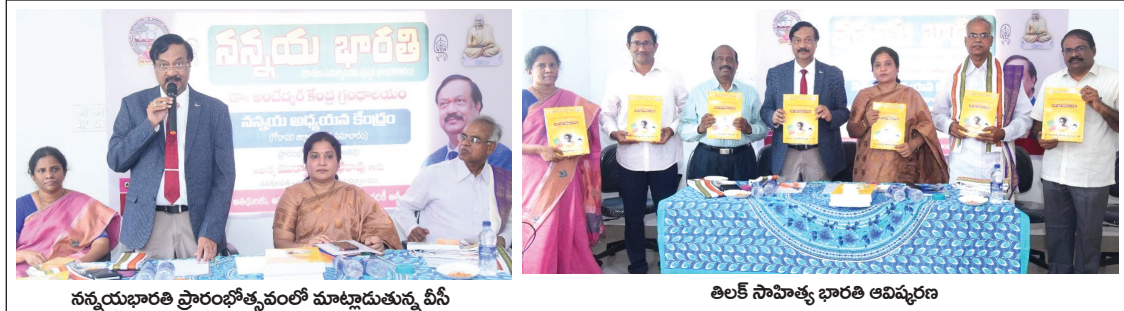
నన్నయభారతి ప్రారంభోత్సవంలో మాట్లాడుతున్న వీసీ తిలక్ సాహిత్య భారతి ఆవిష్కరణ