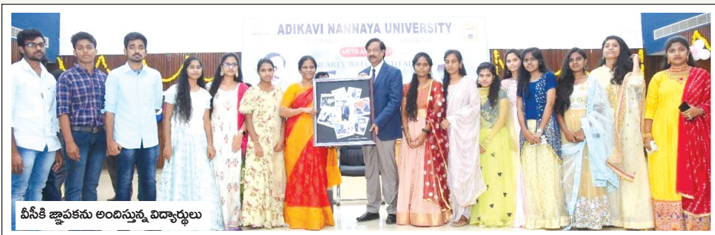
వీసీకి జ్ఞాపకను అందిస్తున్న విద్యార్థులు