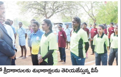
ఖోఖో క్రీడాకారులకు శుభాకాంక్షలు తెలియజేస్తున్న వీసీ